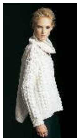
Schlicht, feminin, tragbar, weich: So sieht die Parenti-Kollektion für diesen Herbst/Winter aus